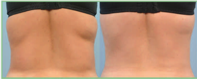
Kuvat ennen ja jälkeen sarjahoidon.